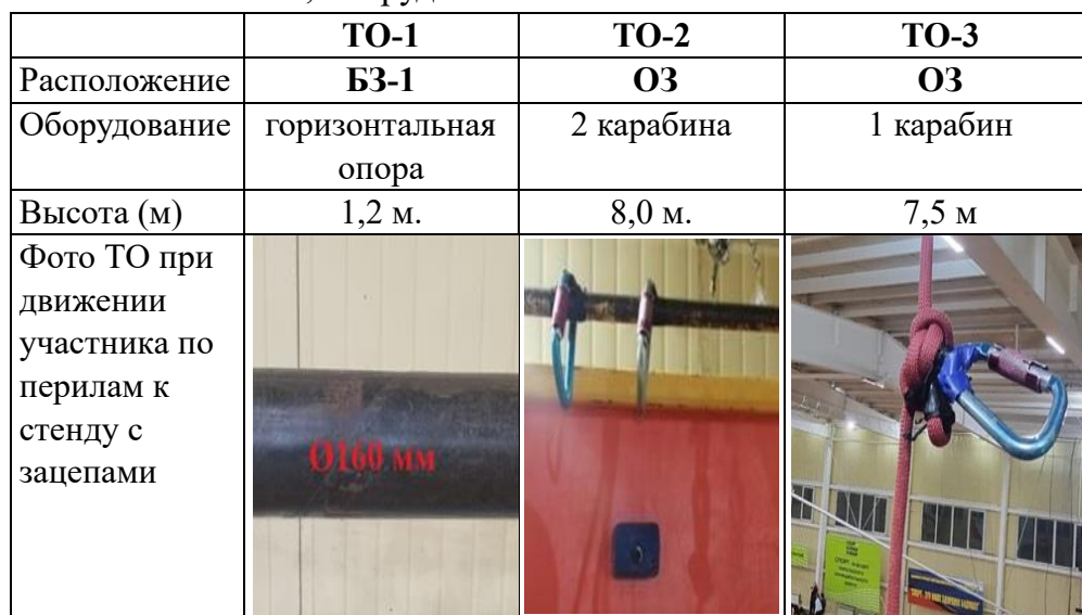
Схема дистанции. Расположение ТО, ВСС и БЗ.