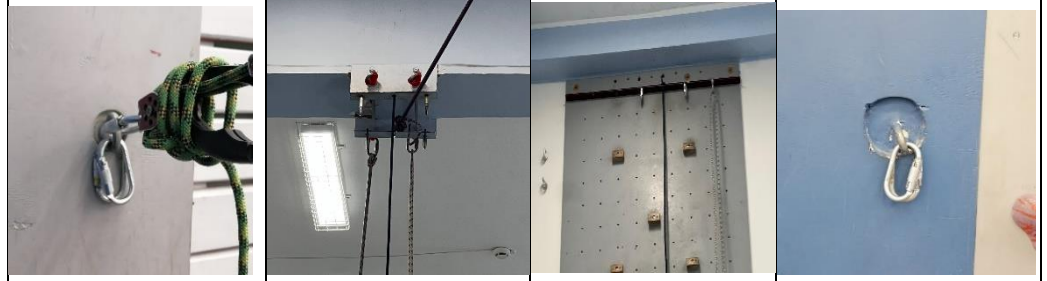
Фото ТО по направлению к стенду с зацепами (фото ТО-1 в противоположном направлении)