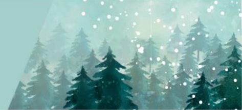
СХЕМА ДИСТАНЦИЙ 3 класс