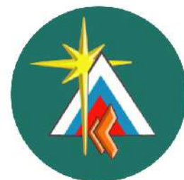
ГАУДО МФТСЦ ИМ. Т.Т. МАРТЫНЕНКО