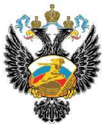
МИНИСТЕРСТВО СПОРТА РОССИЙСКОЙ ФЕДЕРАЦИИ