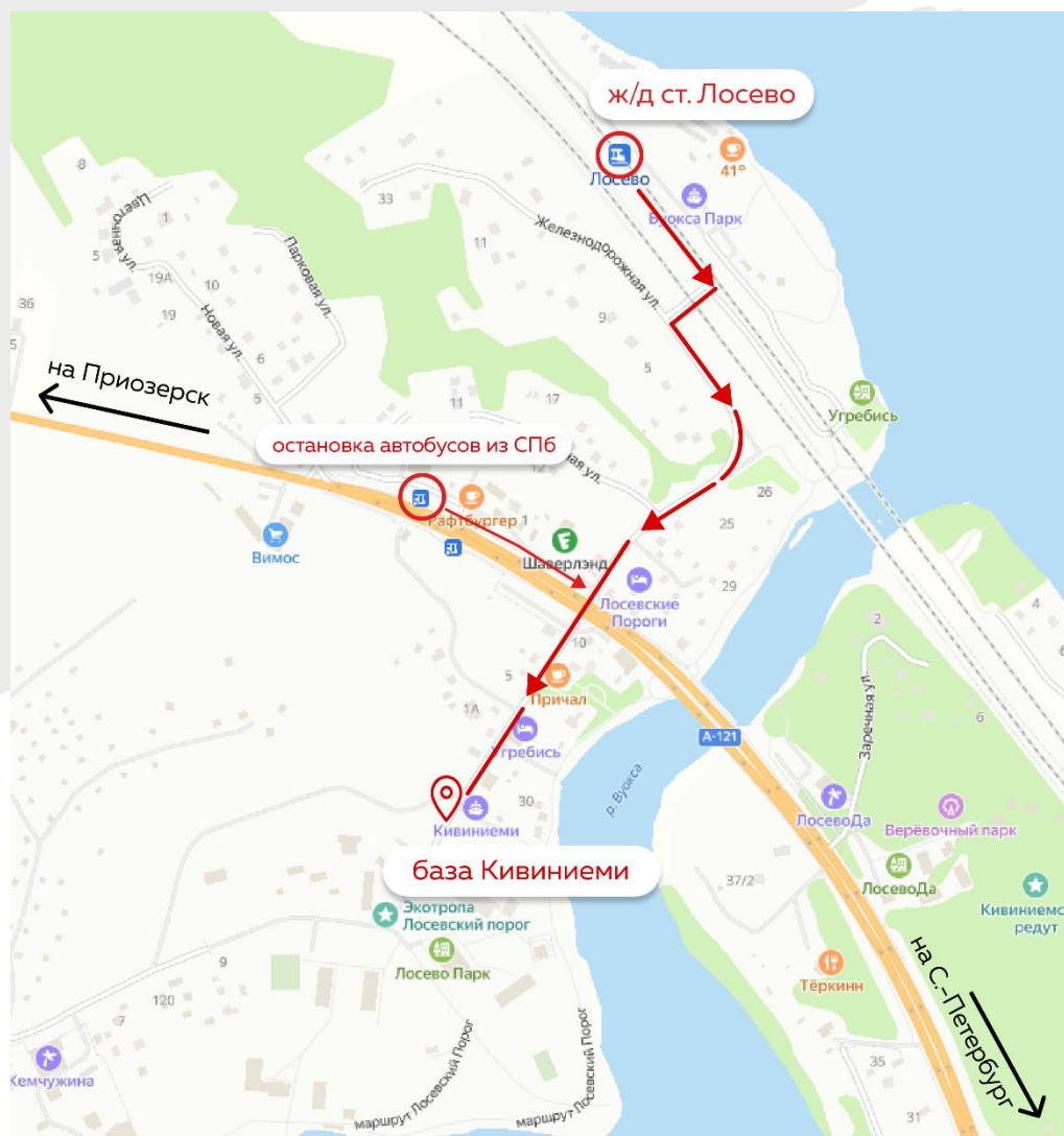
Схема расположения турбазы «Центр рафтинга «Кивиниеми»