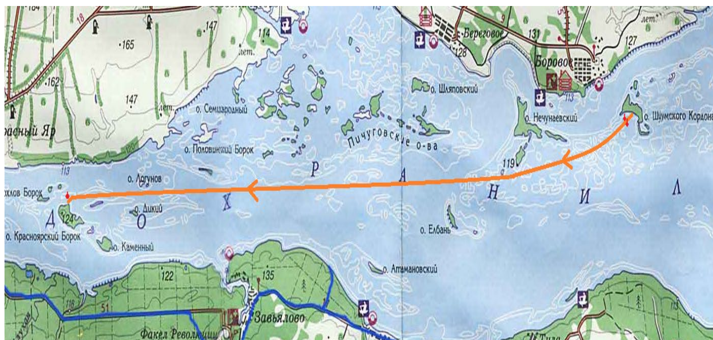
Схема прохождения длинной дистанции:

Дистанция-парусная: длинная, 5 класса. Протяженность до 15 км, количество этапов: 7 шт.: