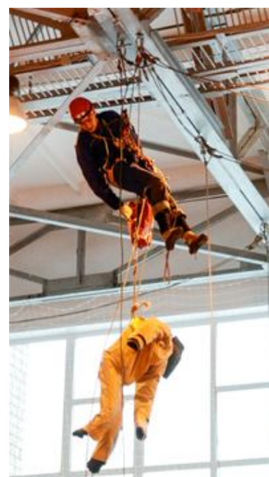
автор фото Кондрасенко А.