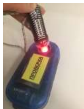
Рис.2 Световой индикатор, при успешной отметке (активации) ЧИПа SIAC в контактной станции «ПРОВЕРКА»