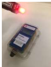
Рис.4 Отметка в бесконтактной станции AIR+ ЧИПом SIAC

При выполнении отметки контактным ЧИПом срабатывают световые индикаторы станции.