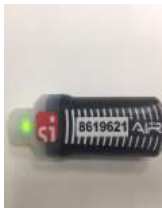
Рис.3 Периодически мигающий зеленый световой индикатор, говорит о том, что ЧИП SIAC находится в активированном состоянии и готов к работе.