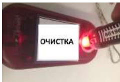
Рис.1 Световой индикатор, при успешной отметке ЧИПа SIAC в контактной станции «ОЧИСТКА»