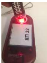
Рис.5 Отметка в контактной станции ЧИПом SIAC