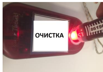
Рис.2 Световой индикатор, при успешной отметке ЧИПа SIAC в контактной станции «ОЧИСТКА»