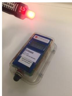
Рис.5 Отметка в бесконтактной станции AIR+ ЧИПом SIAC