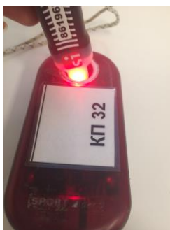
Рис.6 Отметка в контактной станции ЧИПом SIAC