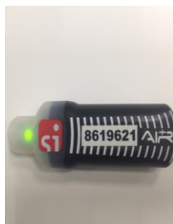
Рис.4 Периодически мигающий зеленый световой индикатор, говорит о том, что ЧИП SIAC находится в активированном состоянии и готов к работе.