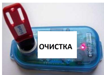
Рис.1 Световой индикатор, при успешной отметке контактного ЧИПа в контактной станции «ОЧИСТКА»