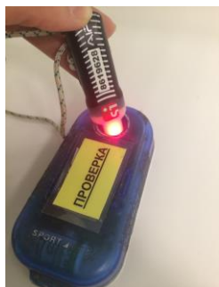
Рис.3 Световой индикатор, при успешной отметке (активации) ЧИПа SIAC в контактной станции «ПРОВЕРКА»