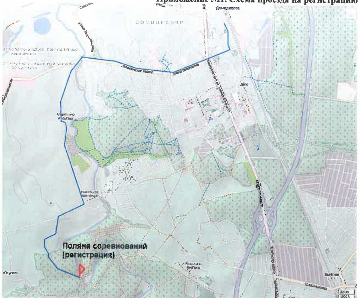
Схема проезда на место старта